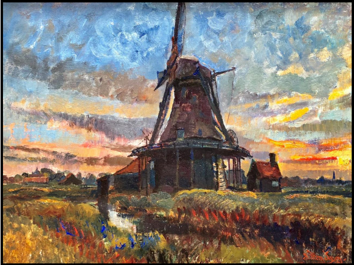
Olieverf van Willem Jansen, gezicht op molen Het Prinsenhof te Westzaan